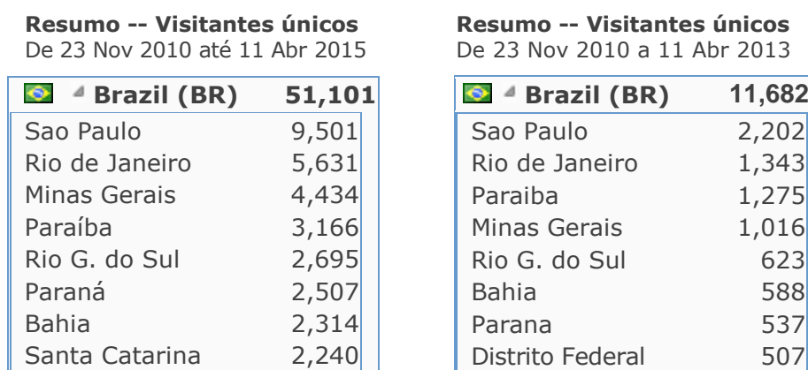
Figura 4 – PBCIB. Dados do ClustrMaps: Abril de 2015 e Abril de 2013.

Sem dúvida a publicação de notícias no facebook e no twitter trouxe maior visibilidade, e conseqüentemente maior número de visitantes para a PBCIB, como se pode observar na contagem de visitantes únicos em 2013 e em 2015: