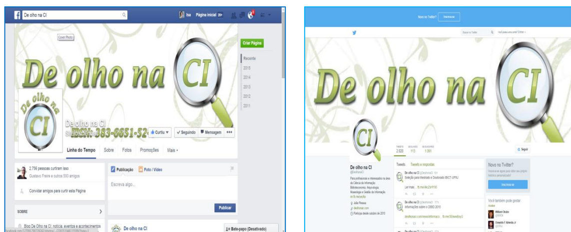
Figura 3 – Mídias sociais do blog : facebook e twitter

Criado o blog , buscamos uma estratégia para incrementar as visitas, optando pela publicação de uma página vinculada ao blog em uma plataforma tecnológica popular, o Twitter . Com o objetivo de disseminar informações publicadas no blog , publicamos o título da notícia e o link em uma única sentença, pois no twitter há um limite de caracteres por mensagem. Percebemos que essa limitação do twitter não possibilita a implementação de estratégias de marketing, e em decorrência definimos o uso dessa ferramenta de comunicação virtual como complementar à disseminação da informação publicada no blog , sem deixar de publicar nessa mídia, cujo uso é bem comum na Internet. O resultado tem sido satisfatório: contabilizamos 2.021 tweets e seguimos 113 fontes de informação, compartilhadas com 1.092 seguidores.