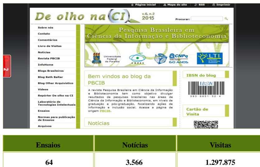
Figura 2 – Página inicial e dados agregados de produção e visitas

Criado o blog , buscamos uma estratégia para incrementar as visitas, optando pela publicação de uma página vinculada ao blog em uma plataforma tecnológica popular, o Twitter . Com o objetivo de disseminar informações publicadas no blog , publicamos o título da notícia e o link em uma única sentença, pois no twitter há um limite de caracteres por mensagem. Percebemos que essa limitação do twitter não possibilita a implementação de estratégias de marketing, e em decorrência definimos o uso dessa ferramenta de comunicação virtual como complementar à disseminação da informação publicada no blog , sem deixar de publicar nessa mídia, cujo uso é bem comum na Internet. O resultado tem sido satisfatório: contabilizamos 2.021 tweets e seguimos 113 fontes de informação, compartilhadas com 1.092 seguidores.