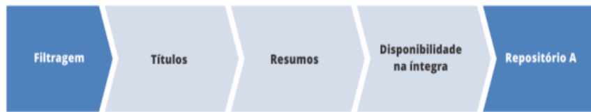
Figura:2 Filtragem do banco de Artigos Bruto