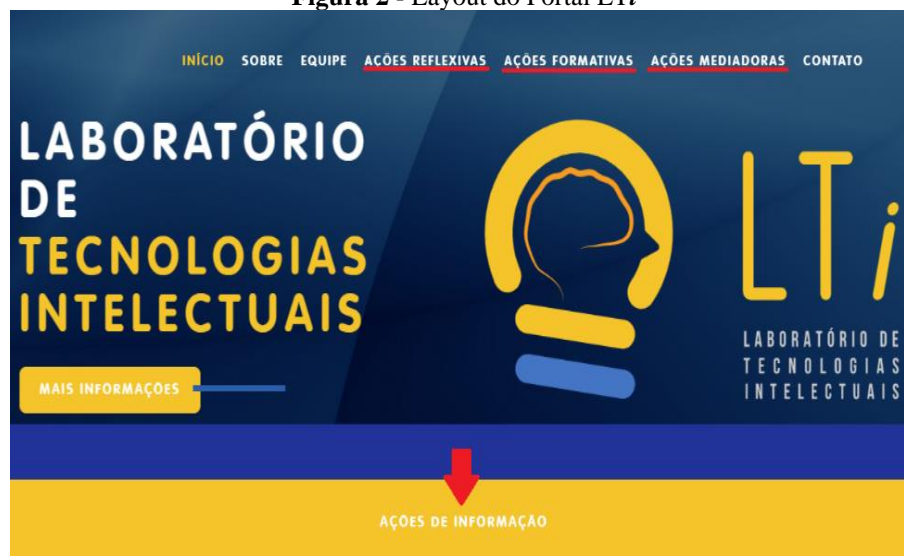
Figura 2 - Layout do Portal LTi