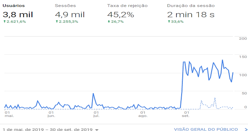
Gráfico 1 - Usuários do Portal LT i : 01/05/2019 a 30/09/2020

Definiu-se o período de cinco meses, do dia 1 maio de 2019 ao dia 30 de setembro de 2019, como espaço de tempo para a caçada. Os dados coletados e analisados nesse período serão comparados, na análise, com os dados do período de 1 maio de 2020 ao dia 30 de setembro de 2020. Segue o Gráfico 1 , contendo a quantidade de usuários que acessaram o Portal no primeiro período informado neste parágrafo.