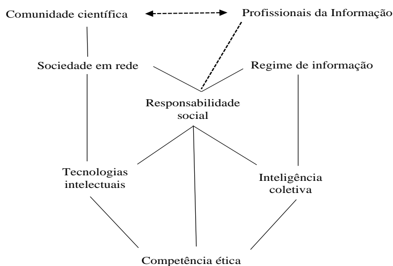
Figura 3 – Rede conceitual da presente proposta