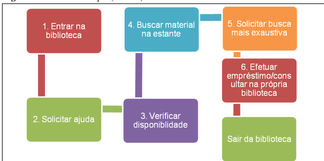
Figura 1 - Ciclo de Serviços (usuário)