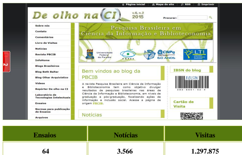
Figura 2 – Página inicial e dados agregados de produção e visitas

Criado o blog , buscamos uma estratégia para incrementar as visitas, optando pela publicação de uma página vinculada ao blog em uma plataforma tecnológica popular, o Twitter . Com o objetivo de disseminar informações publicadas no blog , publicamos o título da notícia e o link em uma única sentença, pois no twitter há um limite de caracteres por mensagem. Percebemos que essa limitação do twitter não possibilita a implementação de estratégias de marketing, e em decorrência definimos o uso dessa ferramenta de comunicação virtual como complementar à disseminação da informação publicada no blog , sem deixar de publicar nessa mídia, cujo uso é bem comum na Internet. O resultado tem sido satisfatório: contabilizamos 2.021 tweets e seguimos 113 fontes de informação, compartilhadas com 1.092 seguidores.