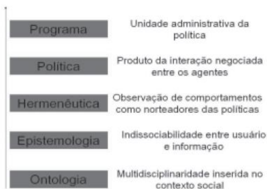
Figura 1: Modelo para a geração de Políticas de Informação