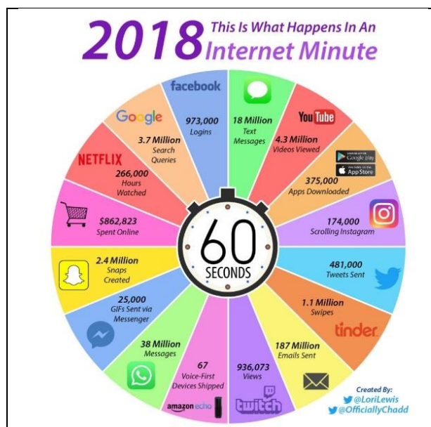
Figura 3: O que acontece em 1 Minuto na Internet em 2018.