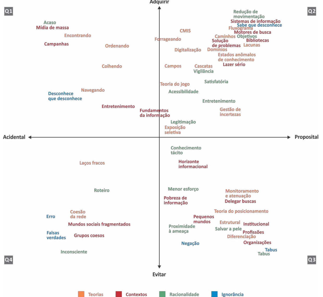
Figura 2: Mapa do comportamento humano em informação