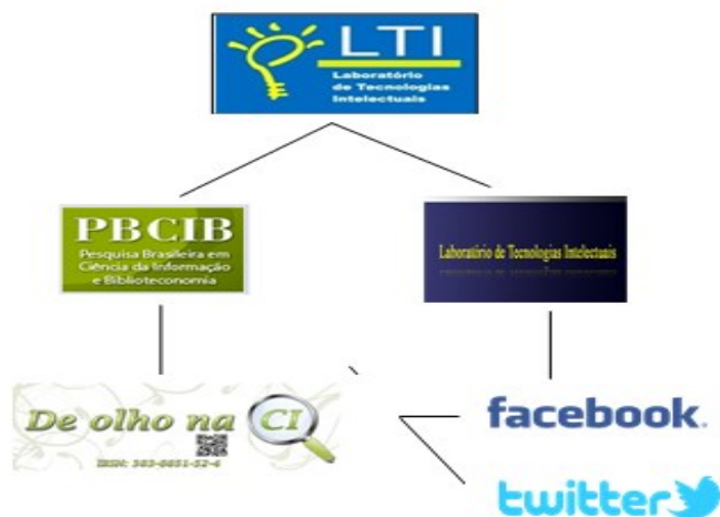
Figura 1: Rede de comunicação virtual do Projeto LTi

O Projeto LTi criou e gerencia uma rede de comunicação virtual constituída pelo Portal LTi , que disponibiliza produtos e serviços de informação, e sua Fanpage ; pelo periódico científico PBCIB, publicado no Portal de Periódicos da UFPB; pelo blog De olho na CI, publicado periodicamente desde 2010, sua Fanpage e Twitter ; e pela Fanpage Na Trilha do futuro.