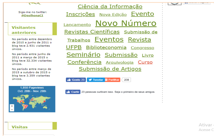
Figura 2: Localização do contador de acessos e nuvem de tags