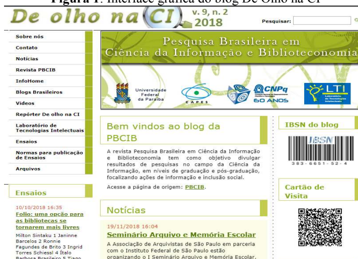
Figura 1: Interface gráfica do blog De Olho na CI