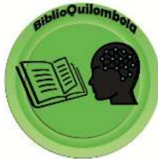
Figura 1 – Logomarca do Projeto BiblioQuilombola

para as práticas leitoras, que podem viabilizar a promoção de competência em informação (Figura 1).