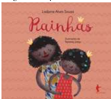
Figura 2 – Capa do livro Rainhas

Na segunda etapa selecionamos textos da literatura afro-brasileira para ser trabalhados, por retratarem temas que se aproximam da cultura e identidade da população participante da investigação. São, portanto, fontes informacionais que são pertinentes para aquele contexto. As obras Rainhas (2018), de Ladjane Alves de Sousa (Figura 2), e Pretinho, meu boneco querido (2008), de Maria Cristina Furtado (Figura 3), são exemplos de tal eleição.