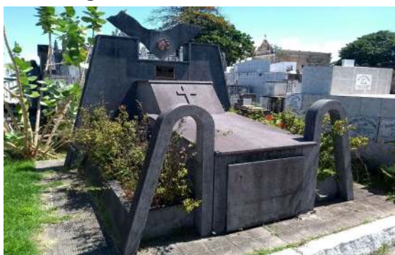
Figura 6 - Túmulo de Muniz Falcão