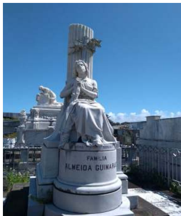
Figura 3: Almeida Guimarães 1892