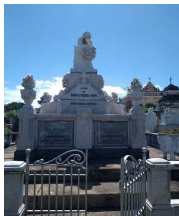
Figura 2 - Túmulo da Família Mendonça