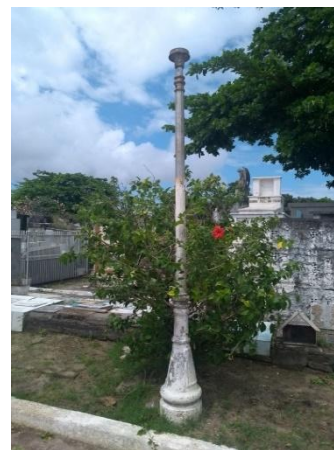
Figura 8 - Poste feito pela Nova Fundação Guanabara - RJ.