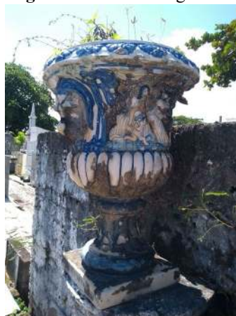
Figura 7 - Vaso Português.

Além dos túmulos, alguns outros objetos significativos também podem ser levados em consideração devido seu valor infomemorial. Trabalharemos nesta pesquisa dois exemplos. O primeiro se trata de 27 vasos portugueses (Figura 7) vindos da cidade do Porto, que adornavam o muro do cemitério e foram retirados em razão do vandalismo e dos furtos. Segundo Chalita (1979), eram belíssimos e feitos de louça portuguesa, sendo vários subtraídos ao longo dos tempos. Em razão disto, os vasos foram retirados das pilastras do muro, onde foram substituídos por pinhas pintadas de branco, e colocados no guarda corpo que vai da entrada do cemitério até à capela. O segundo exemplo são postes (Figura 8) feitos pela Nova Fundação Guanabara, no Rio de Janeiro, que estão presentes por todas as ruas do cemitério, mas que hoje não funcionam mais e estão deteriorados e enferrujados.