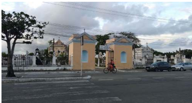
Figura 1 - Parte exterior da Necrópole.

No Cemitério Nossa Senhora da Piedade não foi diferente. Os túmulos diferenciados estão localizados nas primeiras quadras da Necrópole, para chamar a atenção de quem trafega pela Avenida Siqueira Campos, que passa em frente ao cemitério, pelo seu tamanho e ornamentos. Como a entrada é toda em grade, mesmo a uma distância relativa se consegue visualizar o interior do cemitério (Figura 1). Neste trabalho, para fins de exemplificação, escolhemos alguns túmulos e objetos como amostragem da potencialidade informativa destes e de outros que poderão ser explicitados em pesquisa futura.