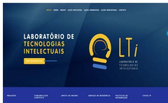
Figura 3 - Interface atual do Portal LTi