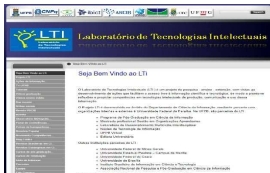
Figura 2 - Interface antiga do Portal LTi