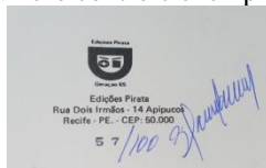
Fig. 7- A logomarca Edições Pirata. Número controle exemplares cortesias 1/100. Assinatura de ZM.

Tribuna do Norte , Natal, RN, 27 maio, 2023. Cena Urbana). Concedeu entrevista ao jornal Dois Pontos , Natal, RN, 30 nov. 1984.