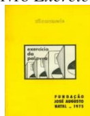
Fig. 4- A capa do Livro Exercício da palavra (1975)