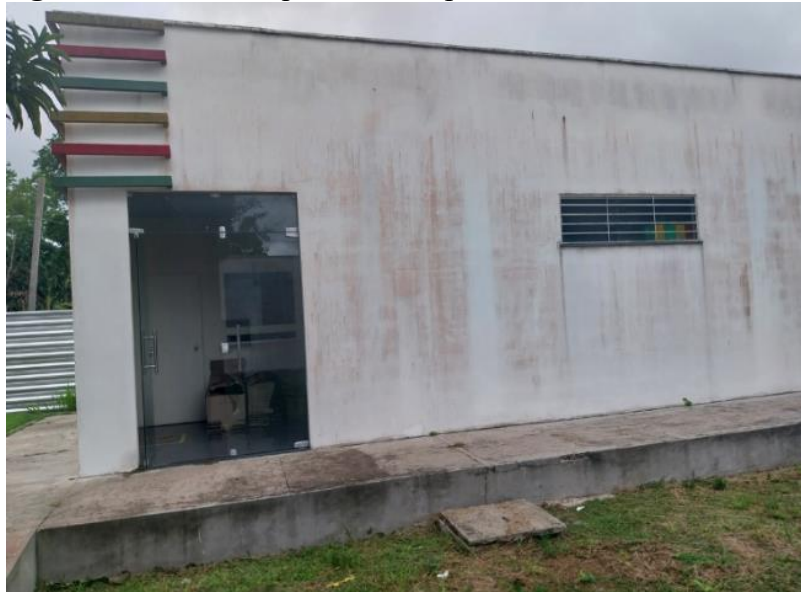
Figura 2: sede do Arquivo Municipal de Barcarena