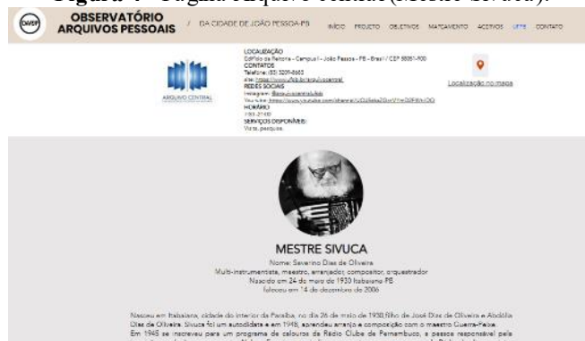
Figura 4 - Página Arquivo central (Mestre Sivuca).

Apresentamos, a seguir, a página do site referente ao acervo do Mestre Sivuca, inserida na página Arquivo Central.