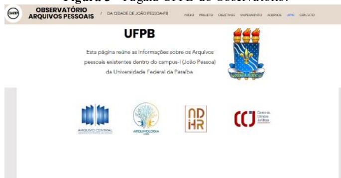
Figura 3 - Página UFPB do Observatório.

A página da UFPB é referente à opção do recorte executado na pesquisa sendo, portanto, nosso principal objeto de análise. Também é a aba que será totalmente construída ao final dessa etapa com a finalidade de ser entregue como amostra do produto.