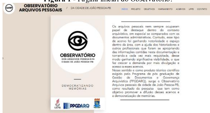
Figura 1 - Página inicial do Observatório.

O site foi dividido em seis abas principais, sendo, respectivamente: INÍCIO, PROJETO, MAPEAMENTO, OBJETIVOS, ACERVOS, UFPB e CONTATOS. Cada aba possui uma função que levará o usuário a conhecer mais sobre o projeto e sobre os acervos e as instituições custodiadoras, como é possível observar na imagem abaixo que mostra a página inicial do Observatório.