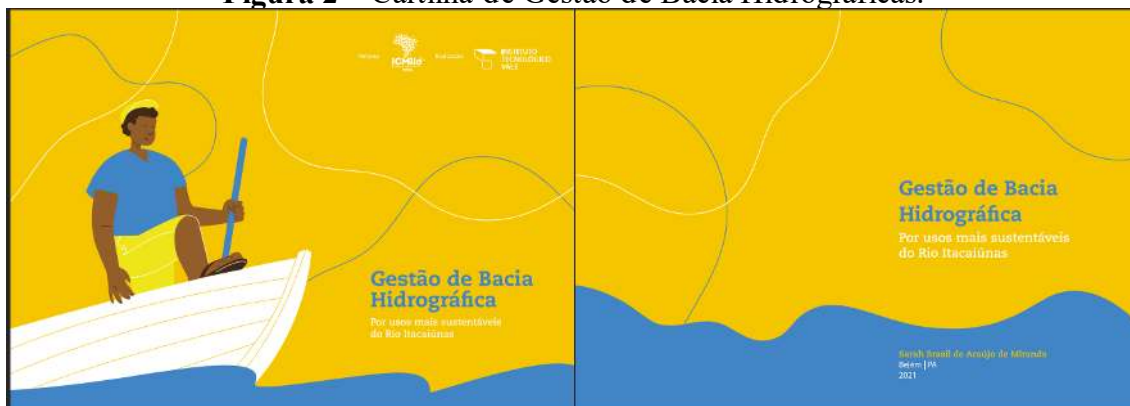
Figura 2 – Cartilha de Gestão de Bacia Hidrográficas.

e técnica. Envolve aprendizado, qualificação e a incorporação de novos valores que são fundamentais para enfrentar os desafios relacionados a esse tema (Figura 2).