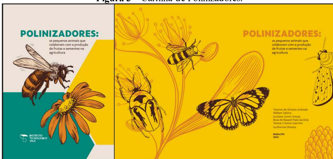
Figura 3 – Cartilha de Polinizadores.

A cartilha Polinizadores: os pequenos animais que colaboram com a produção de frutas e sementes na agricultura (Figura 3) traz a importância da polinização para a agricultura, que impacta diretamente a segurança alimentar. No Brasil, cerca de 85 culturas agrícolas dependem de insetos polinizadores, que são essenciais para a produção de frutos e sementes.