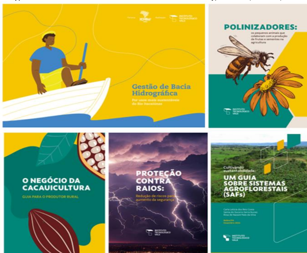
Figura 1 – Cartilhas temáticas do Instituto Tecnológico Vale, Belém, Pará.

A pesquisa de campo foi realizada junto ao repositório institucional 4 do ITV, visto que as cartilhas estão disponibilizadas em acesso aberto, sendo classificado como material público. Dentre as cartilhas mapeadas, totalizam-se cinco produções que abordam subtemas bem específicos dentro da área de Ciências Ambientais (Figura 1). No ano de 2021 a primeira cartilha publicada e intitulada como Gestão de Bacias Hidrográficas: por usos mais sustentáveis do rio Itacaiúnas , produto derivado de uma pesquisa de mestrado. Em 2023, outras duas cartilhas foram publicadas Polinizadores: os pequenos animais que colaboram com a produção de frutas e sementes na agricultura e O negócio da cacauicultura: guia para o produtor rural , que foram elaborados no âmbito da pesquisa de dois projetos do instituto: Capital Natural e Cacau .