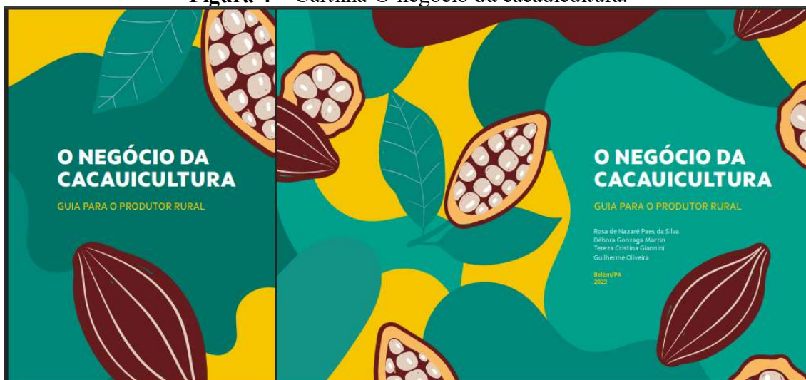
Figura 4 – Cartilha O negócio da cacauicultura.

A cartilha O negócio da cacauicultura: guia para o produtor rural (Figura 4) descreve uma das atividades significativas não apenas para a economia brasileira, mas também para o bem-estar de diversas comunidades. Com o Brasil ocupando a sétima posição na produção de cacau mundial, a cartilha apresenta informações essenciais para a boa gestão dessa cultura.