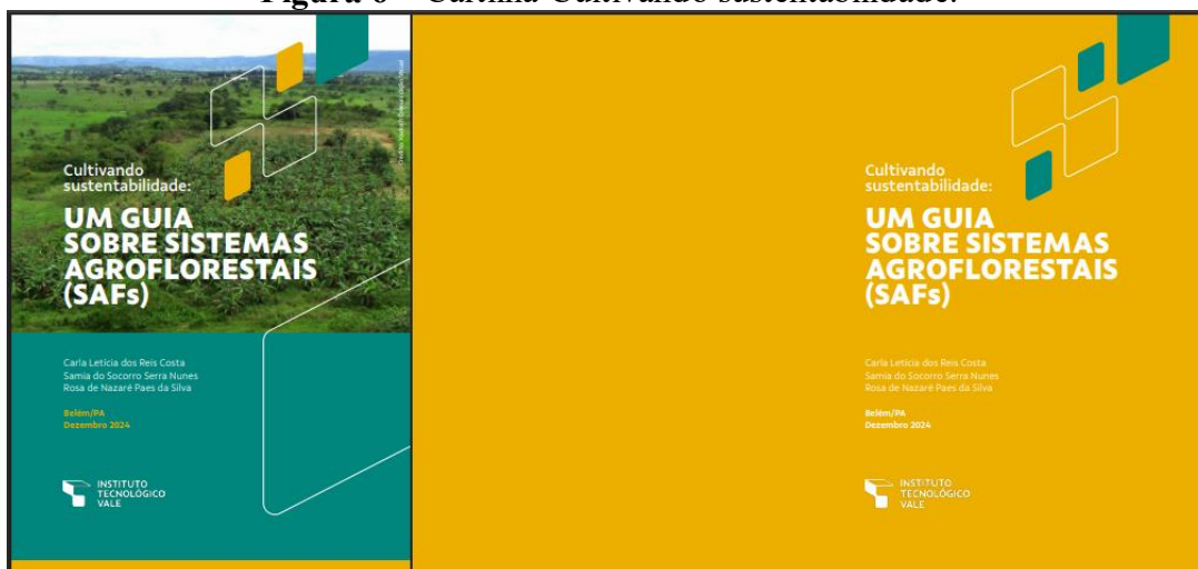
Figura 6 – Cartilha Cultivando sustentabilidade.

Por fim, a cartilha Cultivando sustentabilidade: um guia sobre sistemas agroflorestais (SAFs) (Figura 6) exemplifica o compromisso do ITV, Belém, Pará, com a promoção de práticas agrícolas sustentáveis e a valorização da agricultura familiar. Os SAFs oferecem uma abordagem integrada que combina produção agrícola, conservação da biodiversidade e desenvolvimento econômico.